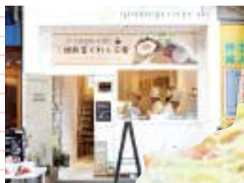
胡麻屋 くれえぶ堂