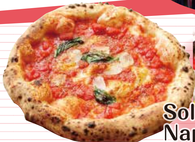
Solo Pizza Napoletana 大須本店