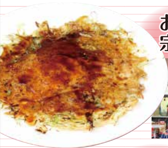
お好み焼き 宗廣家