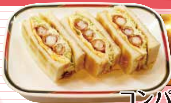
コンパル 大須本店