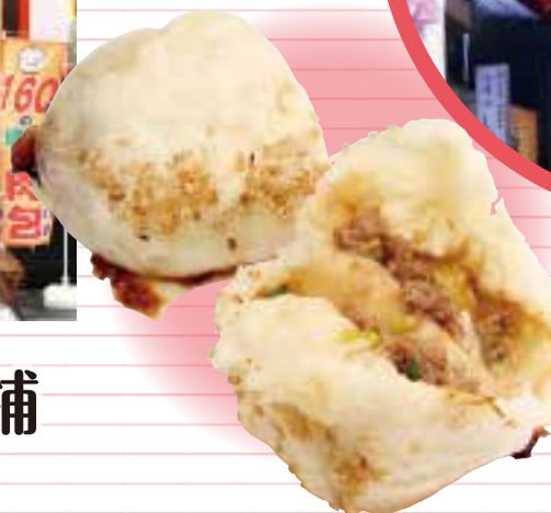
台湾の 焼き包子 包包亭